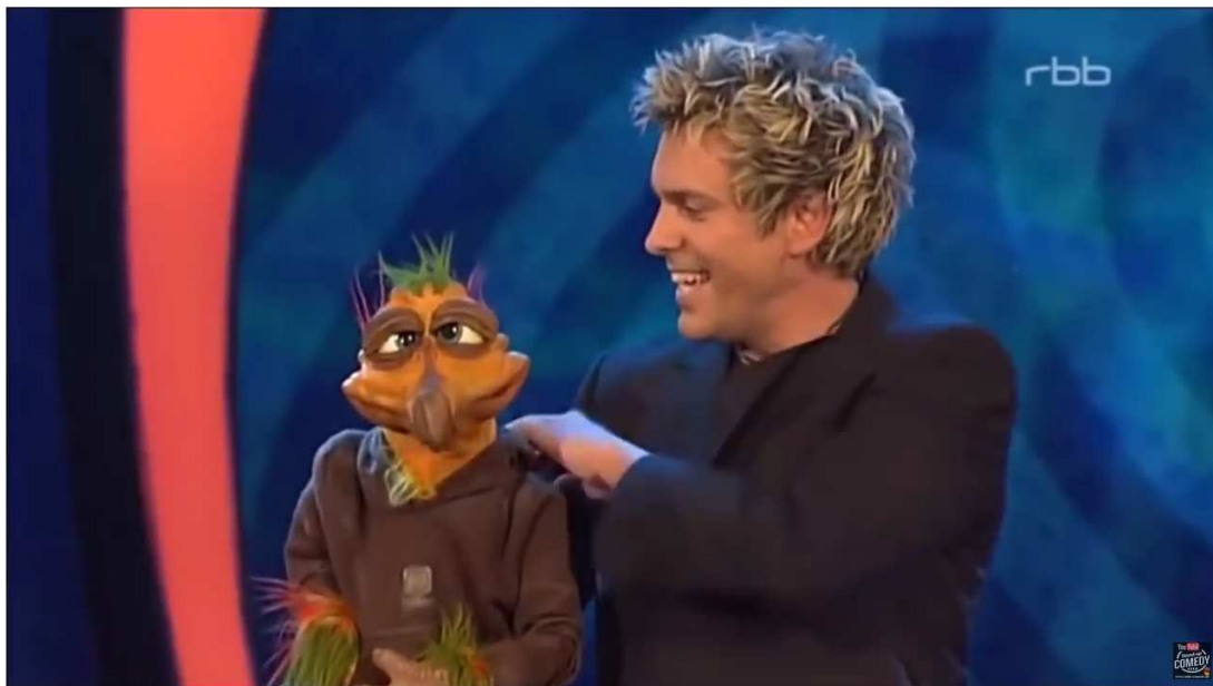
Sascha Grammel - Hetz mich nicht (2017) | Best Comedy & Satire